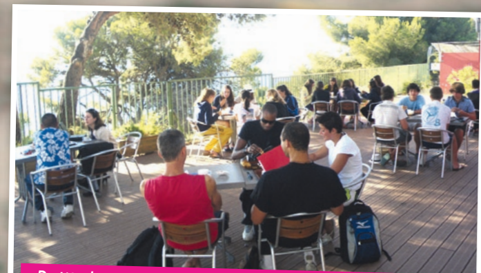
Petit déjeuner à la Maison Familiale de vacances