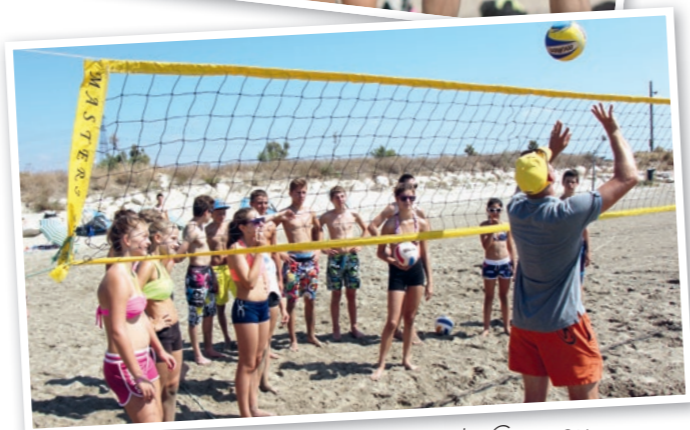
Beach Volley sur la plage du Cavaou