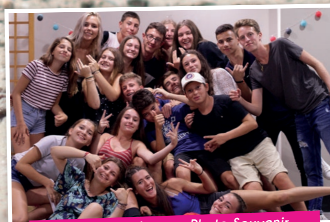
Soirée de clôture : Photo Souvenir