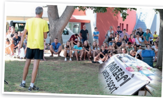
Remise des récompenses