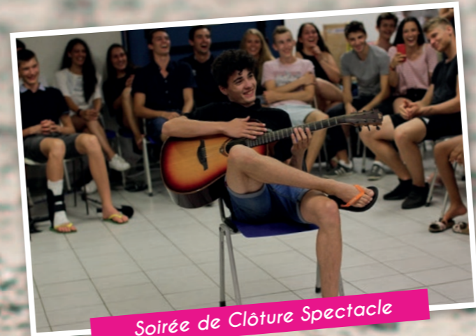
Soirée de Clôture Spectacle