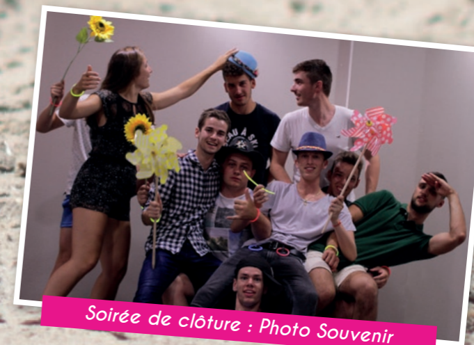
Soirée de clôture : Photo Souvenir