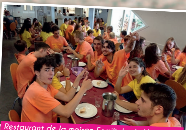
Restaurant de la maison Familiale de Vacances