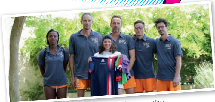
Les cadres lors de la remise des récompenses de la session 1