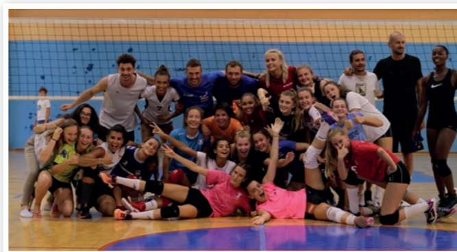
Match cadres / Sélection stagiaires Rencontre féminine