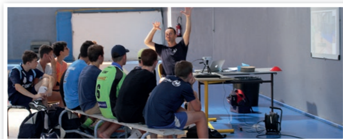
Filmer et visionner