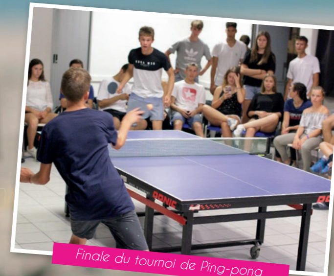
Finale du tournoi de Ping-pong