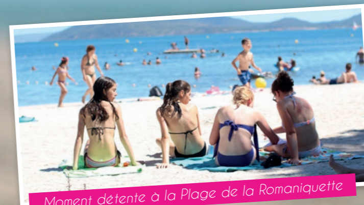
Moment détente à la Plage de la Romaniquette