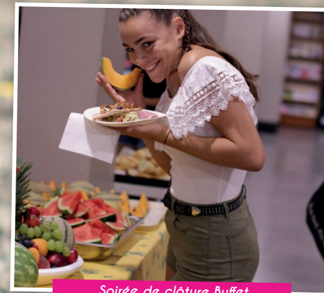
Soirée de clôture Buffet