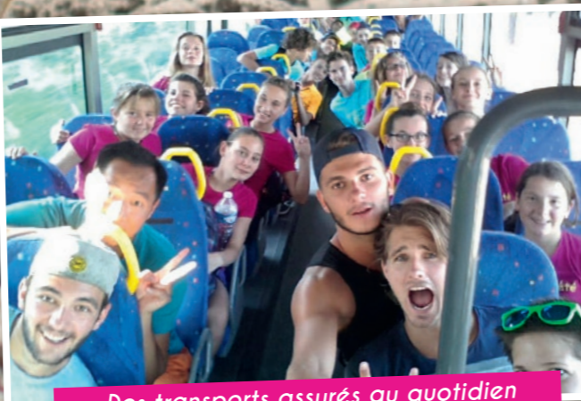
Des transports assurés au quotidien