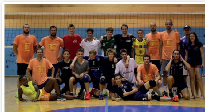
Match cadres / Sélection stagiaires Rencontre masculine