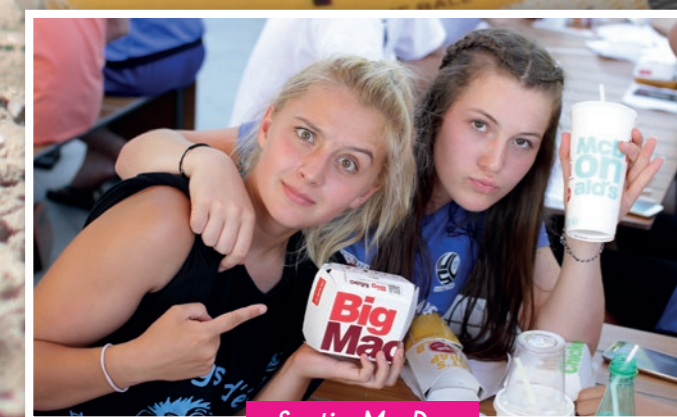
Sortie Mc Do

Plus de photos sur le site du club www.iopv.net